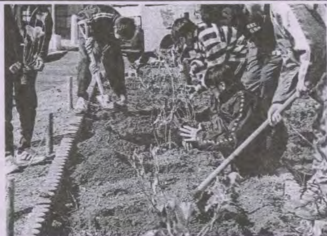
アジサイ約200本が植栽されました。

平成10年から植栽されてきたアジサイは、現在数千株となっており、将来はアジサイの名所としても親しまれることになりそうです。