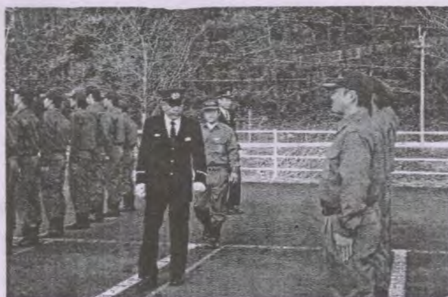
※写真は通常点検（規律や服装の点検）の様子です