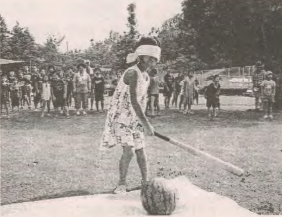
（スイカ割りに挑戦する子どもたち）

初日には、ペットボトルを利用した水鉄砲づくりやスイカ割りが行われました。また、暗くなってからはきもだめしも行われ、子どもたちはおおはしゃぎ、夏休みの良い思い出になったようです。