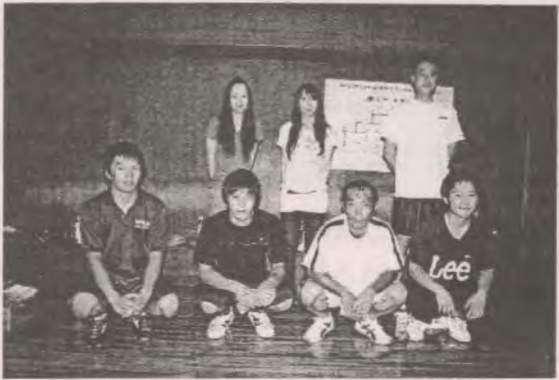
優勝 17部Aチーム（二股）

大会は、白熱したゲームが続き、珍プレー、好プレーが続出。結果は、日頃から練習に取り組んでいる第17部のAチーム（二股）が安定した試合運びで見事優勝を果たしました。上位の結果は次の通りです。