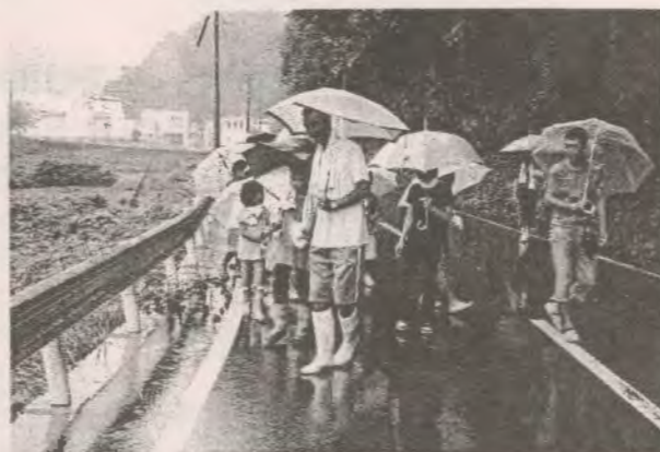
(作業に取り組む東原子ども会)

干支の町づくり運動推進会議では、これからも「美しい町づくり・環境に優しい地域づくり」を推進するためにロードクリーン作戦を実施していきます。