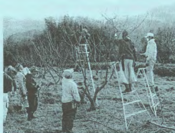
(剪定班による剪定作業：蔵田地区)

現在、42haの栽培が行われておりますが、生産者の高齢化に伴い年々剪定作業が負担となってきています。この負担の軽減を図るため、栗分科会の剪定班が編成されており、現在14名の剪定班により活動が行われています。今年も、3月8日～11日にかけて、約1haの選定作業が行われました。剪定を行うことで、樹勢の維持や収穫労力・管理作業の低減・収量アップが図られます。今後も剪定班の活動が大いに期待されます。