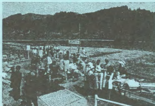
(上崎駅跡地のイベント会場)

また、上崎ふるさとづくり協議会は、菜の花祭りや上崎地区を活性化するための活動等が評価され、平成21年度の延岡市都市景観賞の優秀賞に選ばれています。