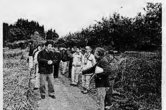
（上崎地区・現地講習会）

今後も、昨年末に結成された東臼杵地域鳥獣被害対策特命チームを中心に研修会等が実施されることになっています。