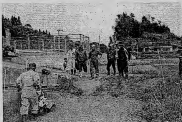
(伏せこみの方法等を確認する会員)