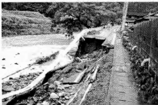
（平成19年8月3日 二股地区台風5号被害）