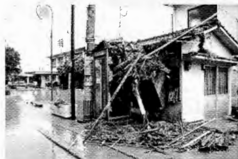
（平成17年9月2日 川水流地区台風14号被害）