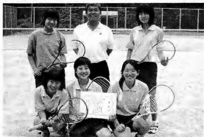
(県大会出場を決めた女子ソフトテニス部)