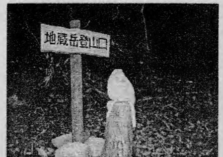
(メンバーの手で備え付けられた登山道入り口の表示とチェーンソーアート)

身近なまちづくりをご紹介するこのコーナー、第二回目は上鹿川地域振興会です。前回ご紹介した北久保山区と同じく、昨年「元気のいい三北地域づくり支援事業」に採択され、だき山・地蔵岳の登山道整備を行いました。近年のアウトドア人気の高まりを受け、登山やロッククライミングがブームとなっていますが、北方町には比叡山や大崩山を始めとする観光資源が豊富にあります。こうした地域資源の価値を市民自らの手で高めることで、地域の活力が育まれるのではないでしょうか。あなたもレッツまちづくり!