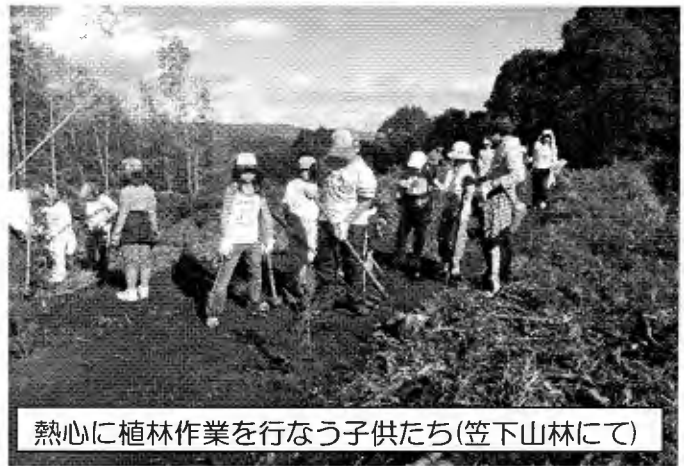
熱心に植林作業を行なう子供たち(笠下山林にて)

また、鹿川チェーンソーアートレンジャー部隊によるチェーンソーアートの見学では、杉の丸太から作られる鯉などの彫刻に歓声が上がっていました。