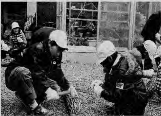
(コマ打ちに熱中する子供たち)

北方町林業研究グループでは、林業の活性化を図るために椎茸教室や様々なイベントの開催を予定しています。