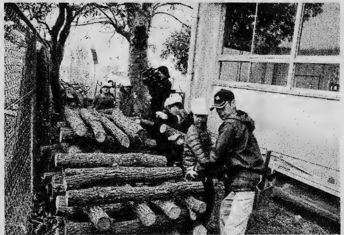
(原木の伏せ込み作業)