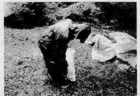
美々地地区の実施状況