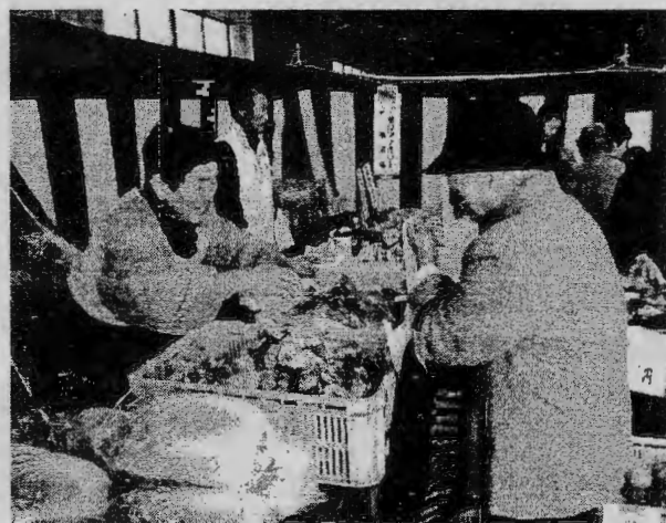
(買い物客との対話も弾んでいました)