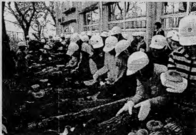
(熱心にほだ起こし作業を行う子供たち)

この椎茸教室は、栽培の仕組みなどを実際に体験してもらう事で林業の大切さを学んでもらおうと開催されたものです。