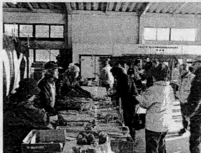
(写真は、自然薯祭りより)

※当日は、市制施行80周年事業「延岡をめぐる4Day マーチ in 北方」が同会場をゴールに開催されます。