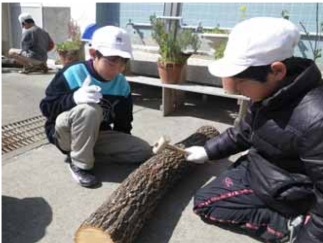
(コマ打ちに熱中する子供たち)

参加した子供たちからは、「コマ打ちは楽しかった。収穫が楽しみ」「林業の大切さがわかった」などと、感想が聞かれました。北方町林業研究グループでは、林業の活性化を図るために椎茸教室や様々なイベントの開催を予定しています。