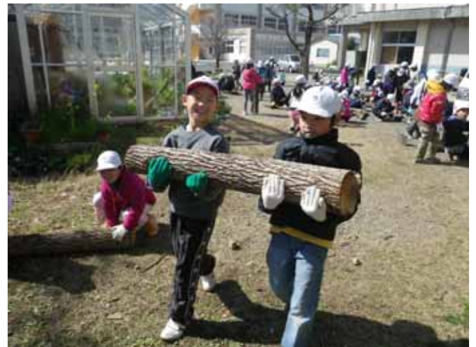
(大きな原木を伏せ込み場所に運搬する子供たち)