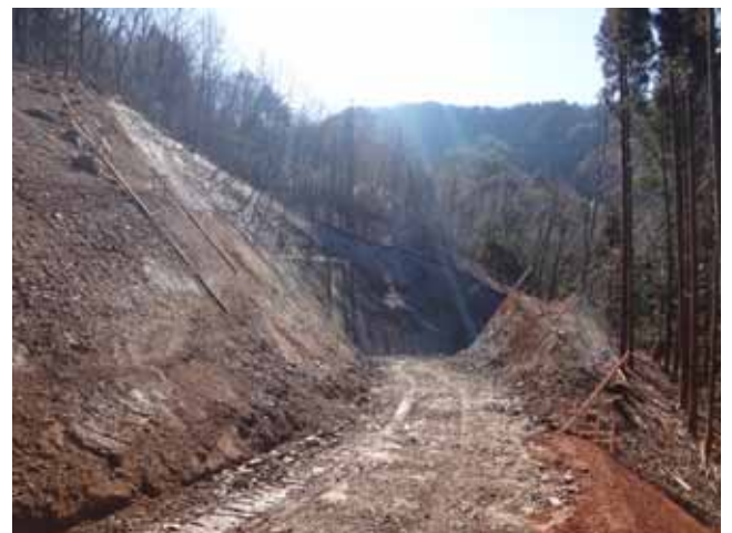
(整備の進む須田の本線)