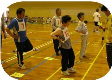
昨年の“体力”はかっちみろ会（北浦体育館）の様子

「“体力”はかっちみろ会」（体力測定会）を今年も下記のとおり開催いたします。今年により楽しく参加できるように新たな「はかっちみろ項目」として糸巻き・10m障害物歩行等4項目を盛り込んでいます。自分の体力に合わせた運動を心がけ“健康貯筋”にチャレンジするために、みんなで参加して“体力”をはかっちみましよう！