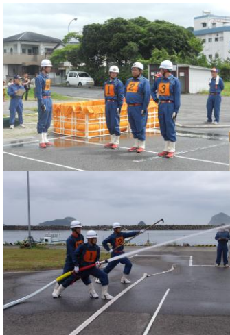
【昨年の大会の様子】