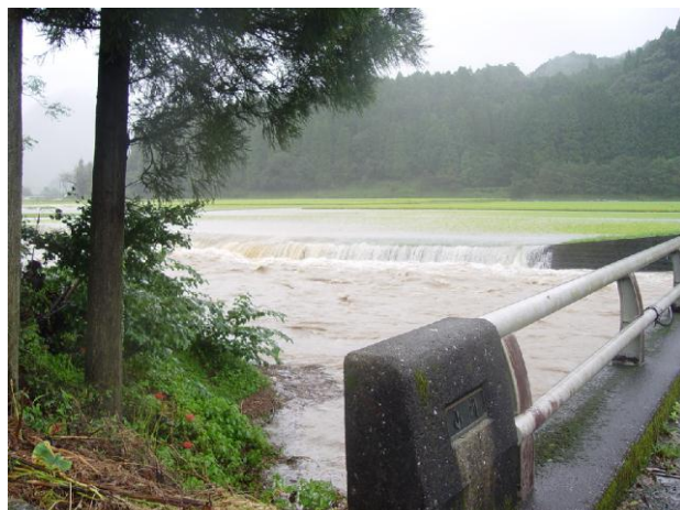
梅木郷ケ水流付近の状況（9月20日撮影） （水田が冠水し、河川へ流入している状況）